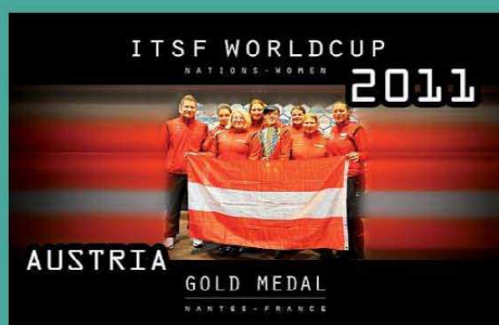
L'équipe d'Autriche championne du monde en titre