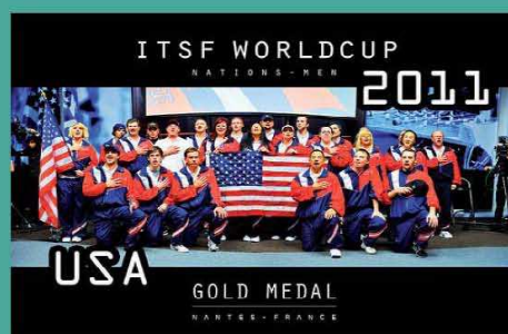
L'équipe des États-Unis championne du monde en titre