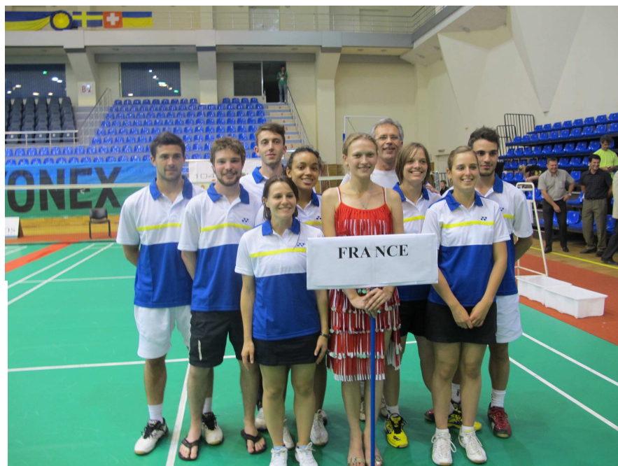
L'équipe de l'Université de Nantes au Chpt d'Europe de Badminton 2012